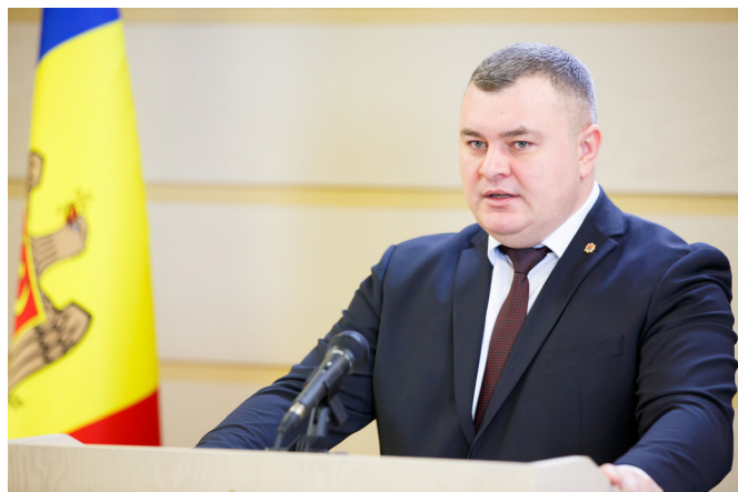
Grigore Novac Președintele Comisiei drepturile omului și relații interetnice

11.08-14.08 Președintele Comisiei drepturile omului și relații interetnice, Grigore Novac, a participat la Summitul mondial și la Conferința internațională de leadership cu genericul "Provocările contemporane la adresa ordinii globale: în asigurarea păcii, securității și a dezvoltării regionale". Evenimentul a fost organizat la Seul, Coreea de Sud, de Federația pentru Pace Universală.